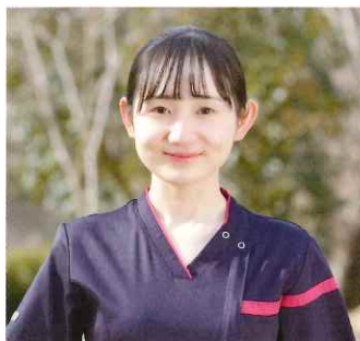
入職1年目 東京都出身 Tさん

身体が辛い状況にある患者さんから「ありがとうございます」と声をかけていただくことがあります。この言葉に自分自身が感謝の気持ちでいっぱいになります。これからもこの気持ちを忘れず、患者さん、ご家族に寄り添い、少しでも良い看護ができるように日々努力していきたいと思っています。