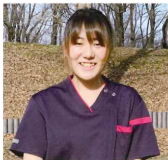
入職2年目 東京都出身 Mさん