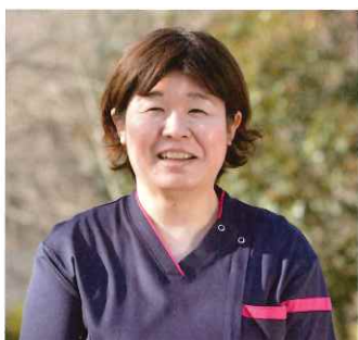
看護主任 / 入職15年目 青森県出身 Yさん

を実感しています。2つ目は、働きやすい環境であること。残業はほとんどなく、ワークライフバランスがとれます。また、研修はすべて時間内で行われるので、プライベートも大事にしながら学ぶことができます。